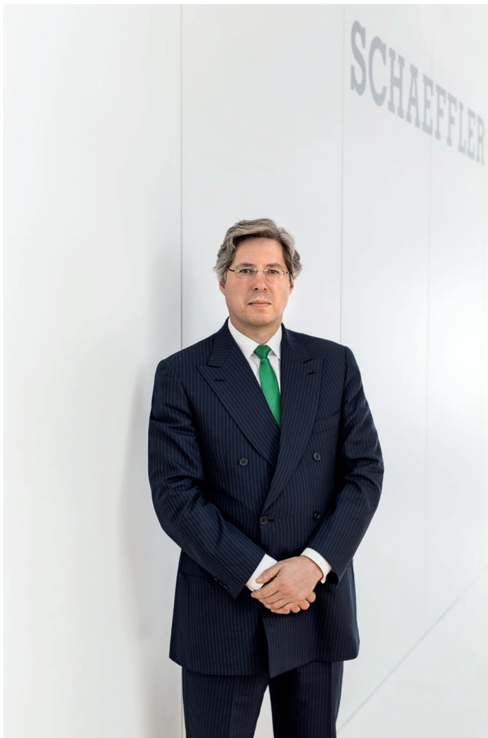
Georg F. W. Schaeffler