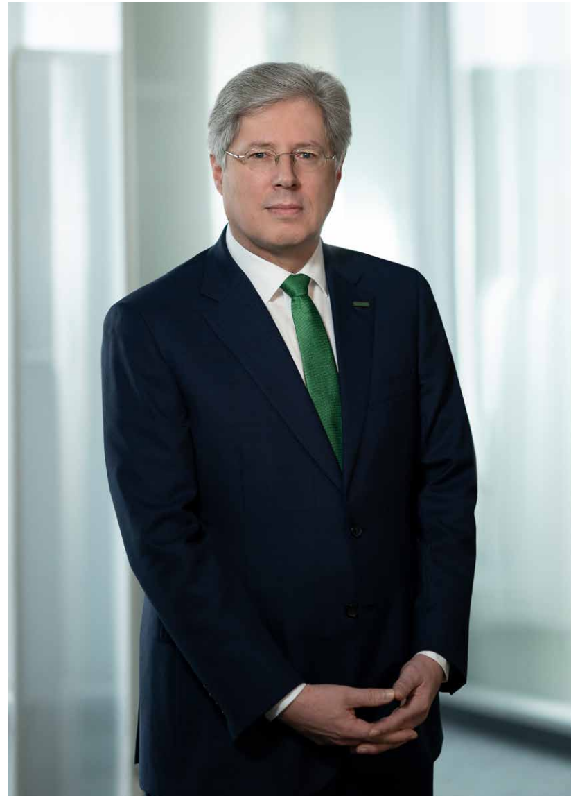
Georg F. W. Schaeffler Vorsitzender des Aufsichtsrats