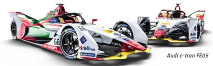
Audi e-tron FE05

Punktesystem 1. 25 Pkt. 2. 18 Pkt. 3. 15 Pkt. 4. 12 Pkt. 5. 10 Pkt. 6. 8 Pkt. 7. 6 Pkt. 8. 4 Pkt. 9. 2 Pkt. 10. 1 Pkt.