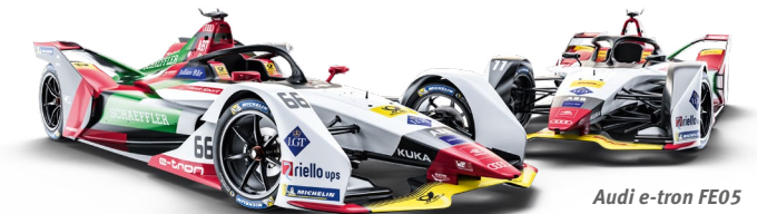
Audi e-tron FE05

Punktesystem 1. 25 Pkt. 2. 18 Pkt. 3. 15 Pkt. 4. 12 Pkt. 5. 10 Pkt. 6. 8 Pkt. 7. 6 Pkt. 8. 4 Pkt. 9. 2 Pkt. 10. 1 Pkt.