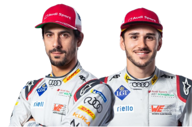
Lucas di Grassi