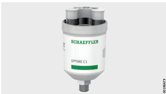
Obrázek 1 OPTIME C1 se sadou baterií