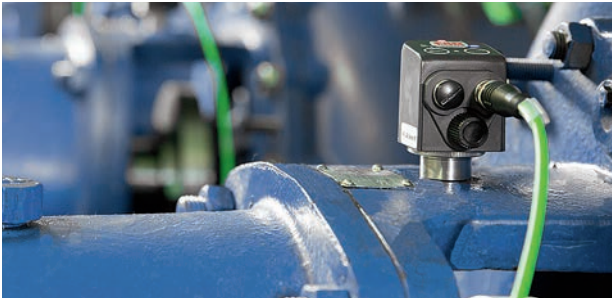
FAG SmartCheck im Einsatz an einer Pumpe