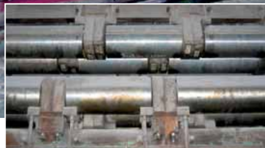
МНЛЗ 1, г. Бекерверт