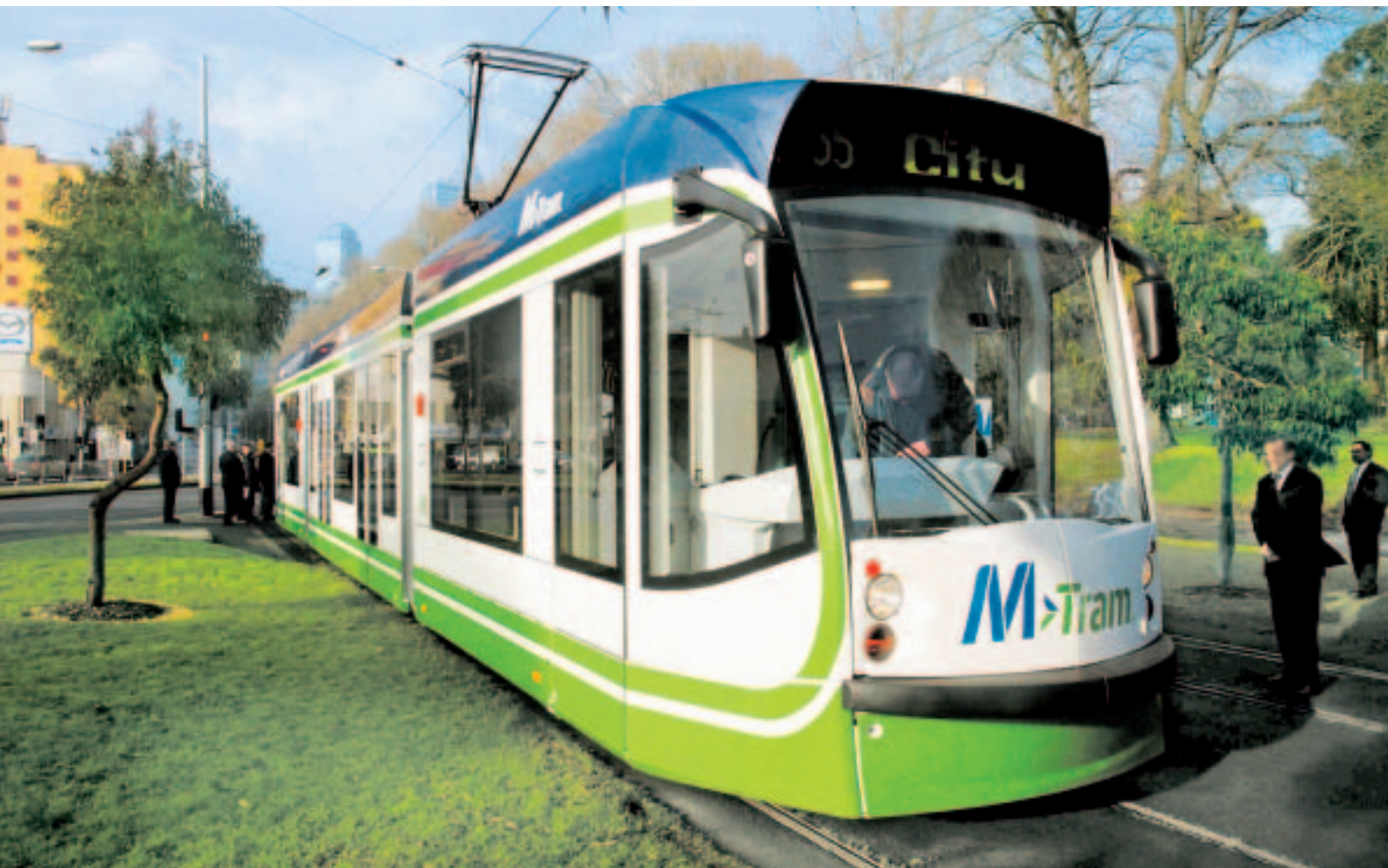
Fünfteiliger Niederflur-Gelenktriebwagen Typ Combino® der Siemens AG, Transportation Systems – Light Rail, Germany