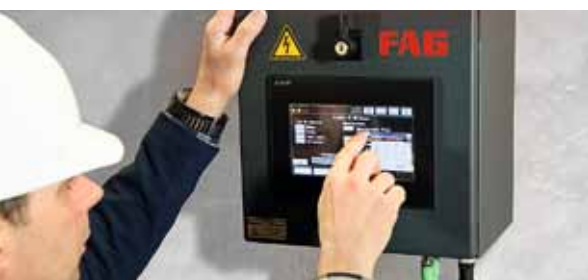
Информация на сенсорном дисплее