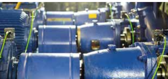
Онлайн-мониторинг состояния электродвигателей и насосов