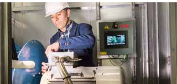
Онлайн-мониторинг состояния электродвигателей и вентиляторов