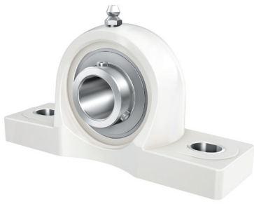
Soporte de apoyo INA