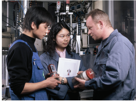
Un experto de servicio explicando el sistema automático de lubricación