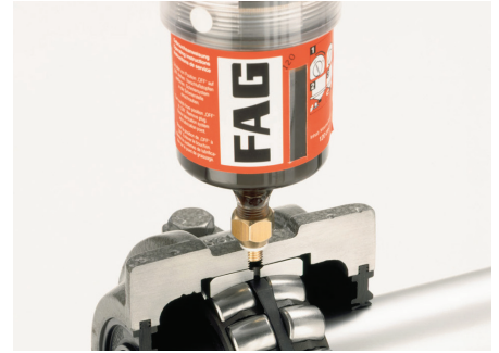
Soporte de apoyo INA con lubricador automático