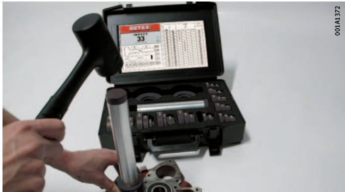
Figura 3 Installazione del cuscinetto con martello e set di boccole di arresto

Le immagini seguenti mostrano l'impiego del set di boccole di arresto e alcuni componenti.