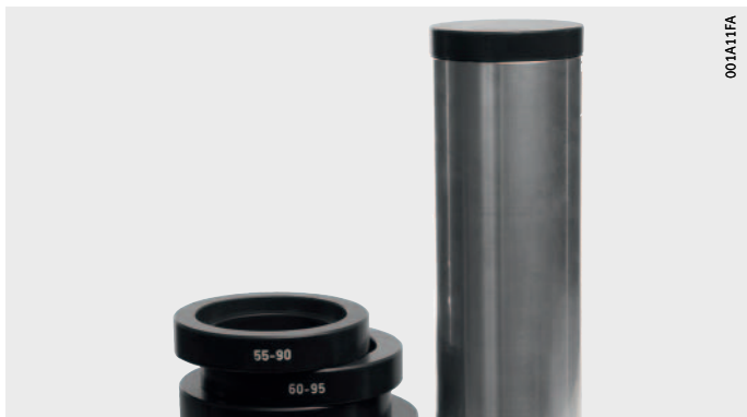
Figura 5 Boccola di arresto e anelli di arresto