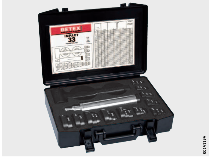
Figura 1 Set di boccole di arresto IMPACT-33