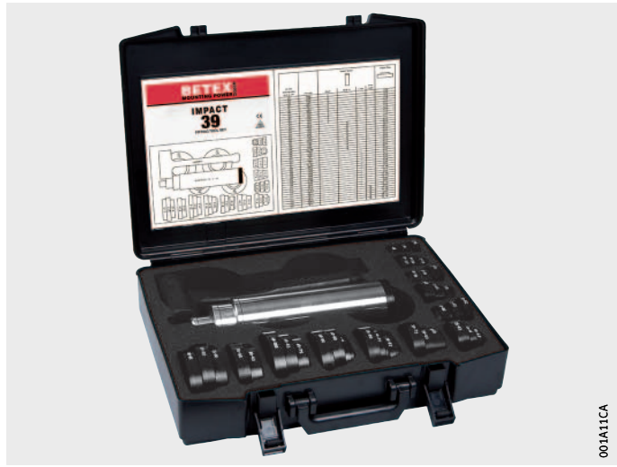
Figura 2 Set di boccole di arresto IMPACT-39