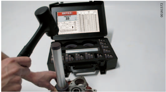
Bild 4 Schlagbuchse und Schlagring bei der Lagermontage