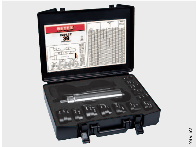
Bild 2 Schlagbuchsenset IMPACT-39