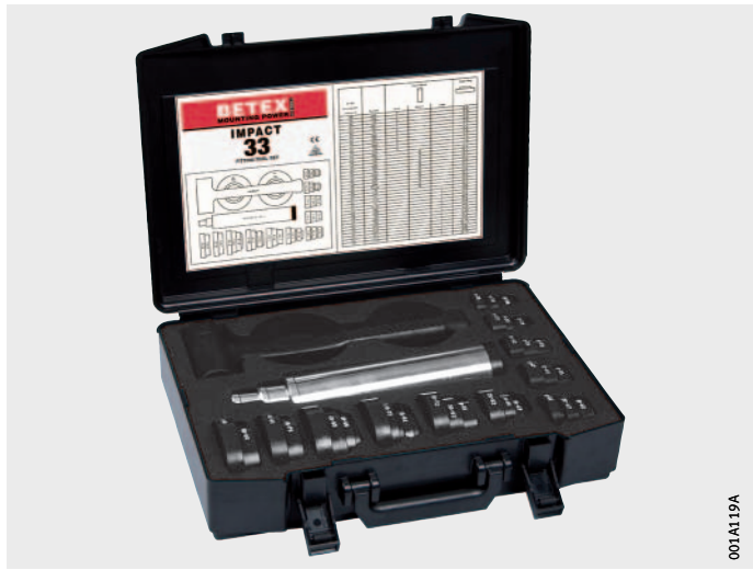
Bild 1 Schlagbuchsenset IMPACT-33