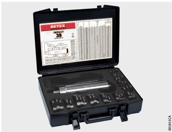
Obrázek 2 Sada rázových hlavic IMPACT-39