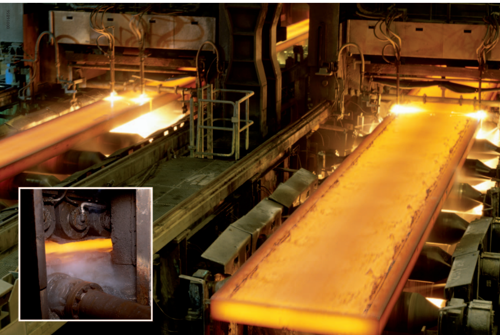
Рисунок 1 · Ролики в МНЛЗ CGM 22