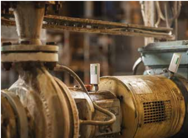
Condition-Monitoring-Lösung Papierfabrik: OPTIME macht sich gut bei der Motorenüberwachung