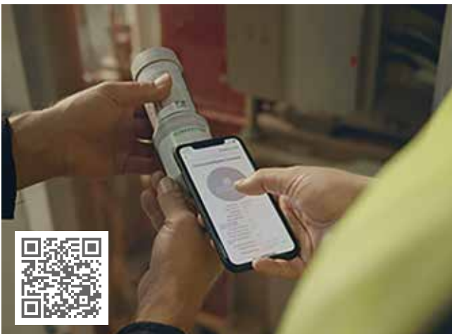
Schon ein vermiedener Mühlenausfall spart 47.000 Euro Stets die Füllmenge des Schmierstoffgebers ortsunabhängig im Blick