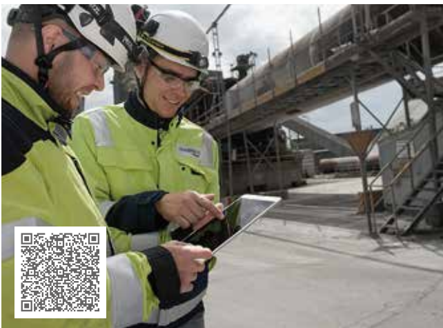
Jährlich rund 90 weniger Maschinenausfälle dank flächendeckender Schwingungsüberwachungslösung mit OPTIME