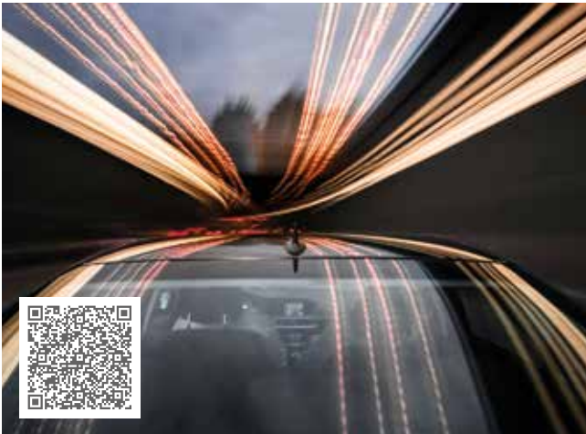
62 Tonnen weniger CO 2 -Ausstoß, Einsparungen bis zu 145.000 Euro Nachhaltiges Lüfterkonzept – mit Überwachungs- und Schmierlösung Lösung mit: ProLink CMS und CONCEPT8