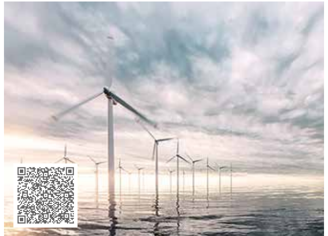
Dongfang Electric Corporation spart 1 Mio. Euro dank optimaler Schmierung im Wellenlager mit Arcanol Load460