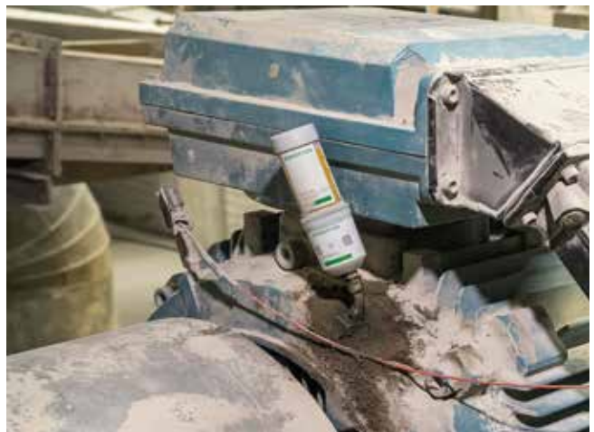
Schmierlösung Zement: OPTIME C1 schmiert punktgenau und gibt dank der smarten Technologie stets ortsunabhängig den Status auf einem (mobilen) Endgerät an