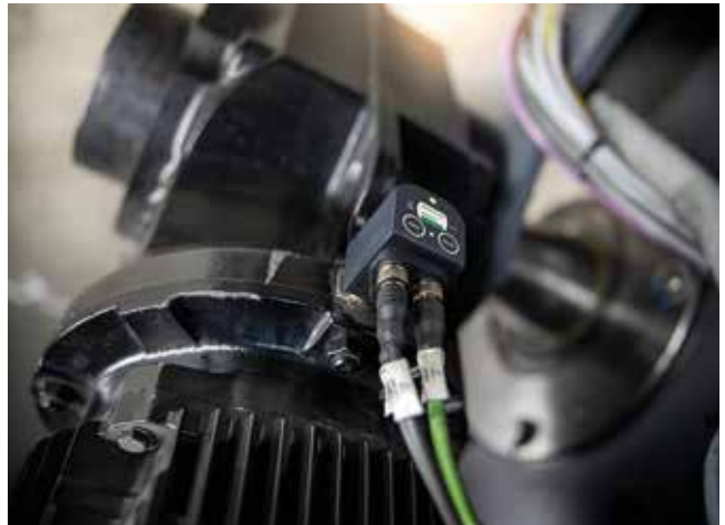
Condition-Monitoring-Lösung Logistikzentrum: SmartCheck überwacht Motoren von Regalbediengeräte