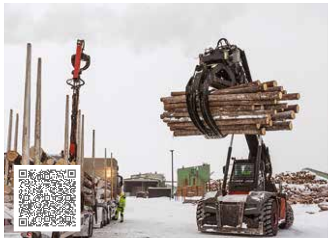
20.000 Euro im Sägewerk Norra Timber gespart mit der Überwachungslösung SmartCheck keine ungewollten Stillstände mehr