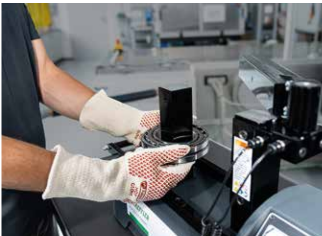
Industriewerkzeuge – Montage Industrie: HEATER verhindern durch die schonende Induktive Erwärmung Schäden wie zum Beispiel unruhiger Lauf, Brüche oder Schürfmarken