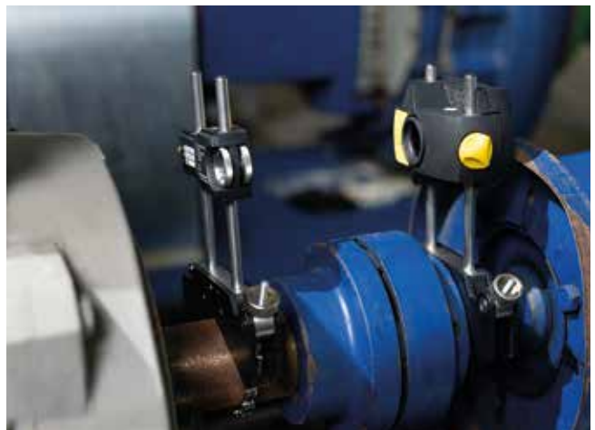
Industriewerkzeuge – Ausrichten Industrie: LASER-EQUILIGN2 sorgt dank der Singel-Laser-Technologie stets für eine fachgerechte Ausrichtung ihrer Maschinen