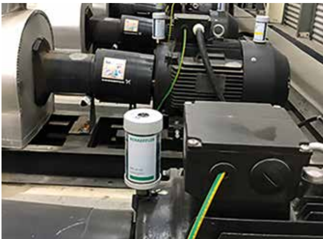
Schmierlösung Industrie: CONCEPT1 schmiert zig Motoren