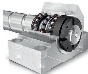
三个密封的BSB...-SU-XL支撑丝杠轴端

BSB...-SU和BSB...-SU-XL的对比显示了更高的基本额定动载荷 增加了基本额定寿命