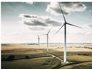
Generatoren in Windkraftanlagen

Der Einsatz unserer Lager hat sich bereits bei vielen Industrieanwendungen in der Praxis erfolgreich bewährt.