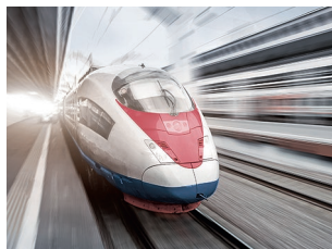
Fahrmotoren in Schienenfahrzeugen