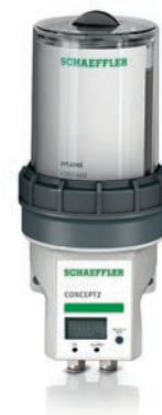
CONCEPT2 mit Kartusche