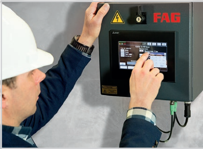
Visualización en el panel táctil