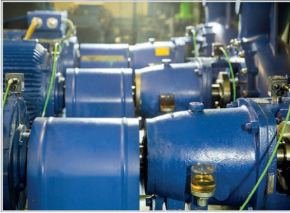
Monitorización online de motores y bombas