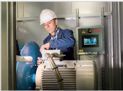
Monitorización online de motores y ventiladores