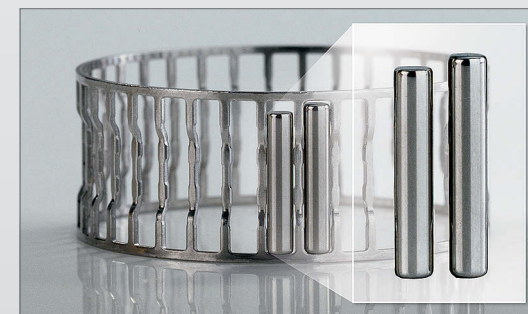
Comparação do tamanho da agulha do rolamento padrão com as agulhas mais longas da coroa de agulhas otimizada.